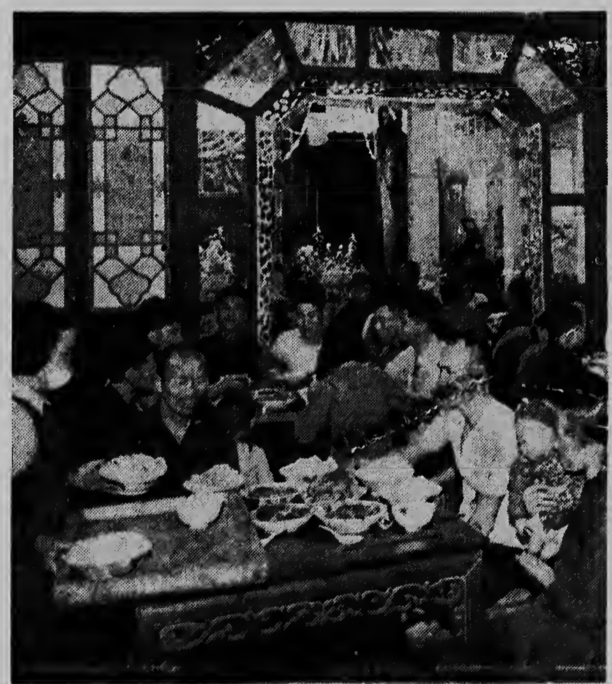
Nos ta mira aqui un cantine den un dje Volkscommunes chinas.